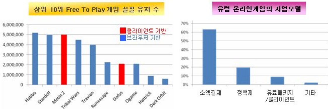
Chart 유럽 온라인게임 시장 현황