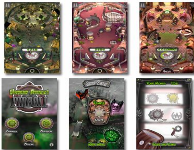
‘Undead Attack!’의 게임 스크린샷 화면