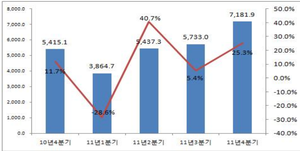
<표 4> '10년 4분기~'11년 4분기 광고산업(상장사별) 영업이익액 변동