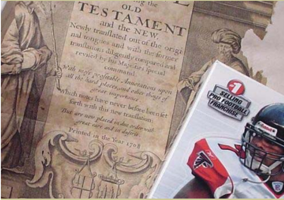
가 (Pricing Strategy)