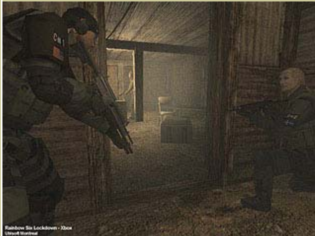
Rainbow Six Lockdown - Xbox Lithell Marine