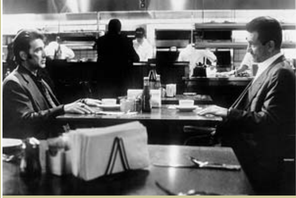
가 , (Pacino) (De Niro) (Heat)