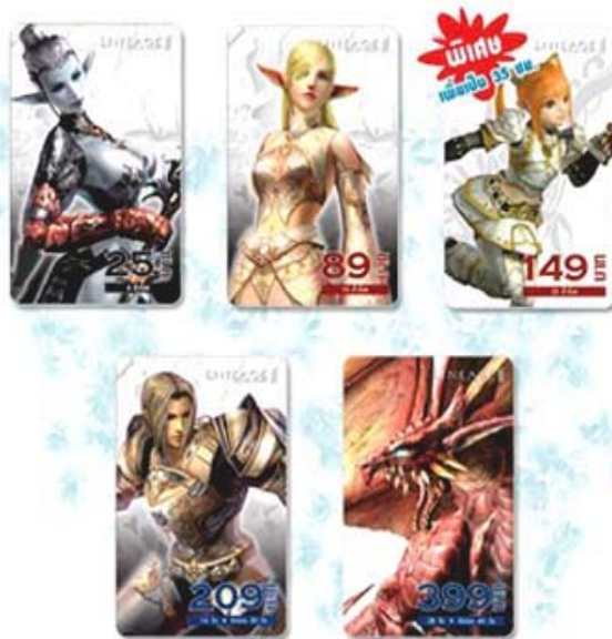
【태국에서 판매중인 '리니지 2' 선불 카드】

일반적인 게임아이템의 경우 시간제, 기간제 상품으로 구매하여 충전된 온라인상의 현금으로 게임을 하거나 아이템을 구매하는 방식을 사용하고 있으며, 아이템의 월정액 평균가격은 개별 캐릭터별로 차이가 있지만, 약 2~3불 수준이다.