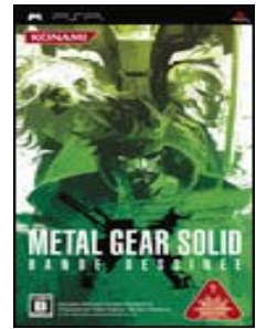
▲ Metal Gear Solid Bande Dessinee