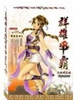
▲ 삼국영웅전 군웅쟁패