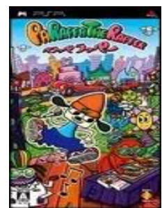
▲ Parappa The Rapper