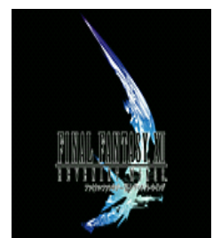
▲ Final Fantasy XII Revenant Wings