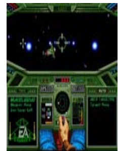
▲ EA Replay