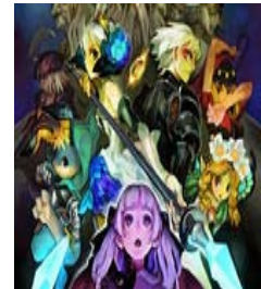
▲ Odin Sphere