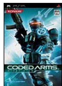
▲ Coded Arms